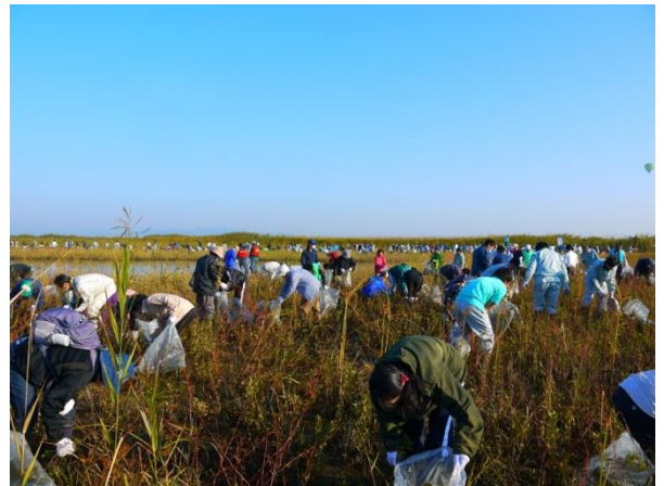
前回(10月19日)の除去作戦。約1,000名の方にご参加いただきました。

主催 小山市、野木町、小山市教育委員会、ラムサール条約登録湿地「渡良瀬遊水地」第2調節池及び周辺地域生物多様性保全協議会(ラムサール湿地ネットわたらせ、日本野鳥の会栃木、渡良瀬遊水池を守る利根川流域住民協議会、わたらせ未来基金、ふゆみずたんぼ実験田推進協議会、コウノトリ・トキの舞うふるさと おやま をめざす会)、小山市渡良瀬遊水地治水推進・ラムサール賢明な活用・周辺整備推進期成同盟会 後援 (予定) 国土交通省関東地方整備局利根川上流河川事務所、一般財団法人渡良瀬遊水地アクリメーション振興財団 特別協力 株式会社伊藤園 協力 思川西部土地改良区、小山建設業協同組合、小山市地籍調査推進協議会、栃木県南舗装協同組合、小山市電気設備業協会、栃木県塗装業組合小山支部、小山市管工事業協同組合、小山市造園建設業協会、小山商工会議所、間々田商工会、小山市美田商工会、桑絹商工会、小山商工会議所女性経営者会、小山市工業団地連絡協議会、足利銀行、栃木銀行、足利小山信用金庫、常陽銀行、小山市市民活動センター登録団体、栃木県立小山北桜高等学校