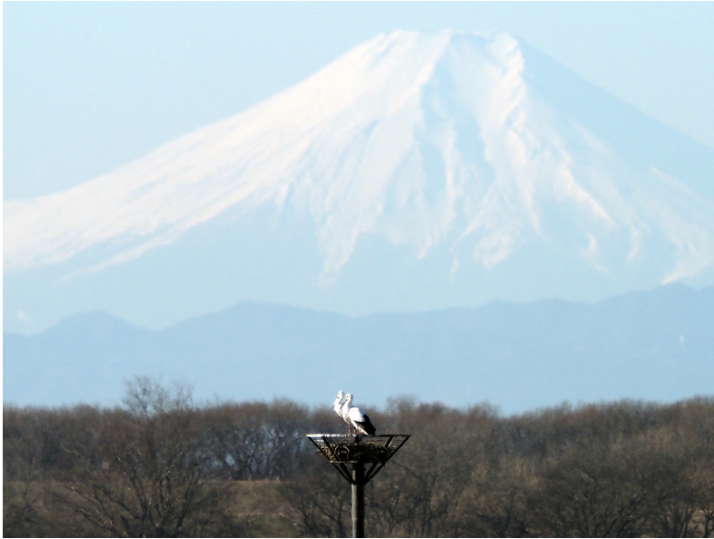
コウノトリが2020年から野外繁殖しています。